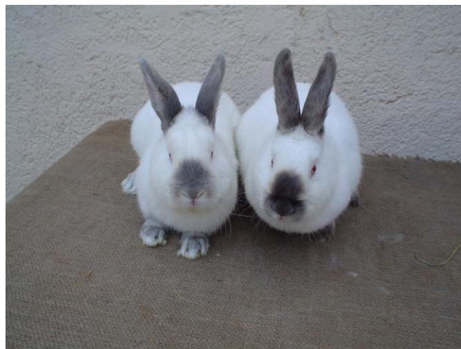
Zľava Nitriansky divo modrý - Ni divm a sprava Nitriansky modrý - Ni m.